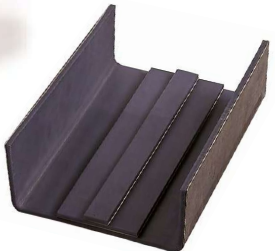
Rhino Hyde®/Standard SM, Abgekantetes Kettenförderteil mit Schleiß- und Kettenführungsschiene

Das Material ist säure- und laugenbeständig und für den dauerhaften Einsatz zwischen -30°C und +120°C geeignet.